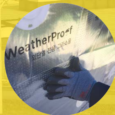
⑤ 웨더프루프 실링 테이프를 제품 조인트 부위에 부착한다.