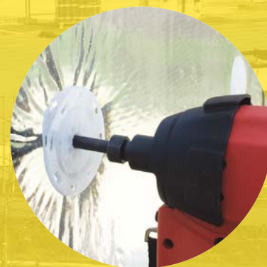
④ 타격식 화스너 전용 가스총으로 화스너에 내장된 핀을 벽면에 고정한다.