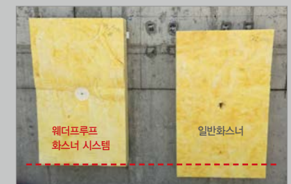
[그라스울 처짐 비교]