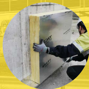
② 웨더프루프를 시공할 구조체에 고정한다.