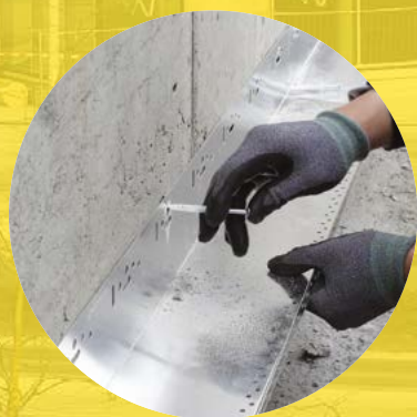
① 웨더프루프 트랙을 시공부위 하단에 설치한다.