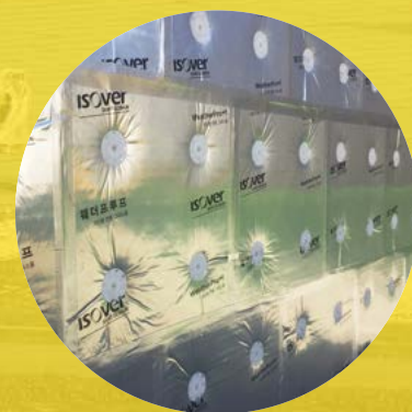
⑥ 시공 완성 사진