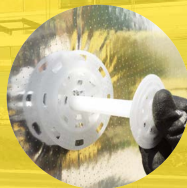
③ 웨더프루프 화스너와 캡을 시공하여 지지력을 강화한다.